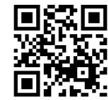
エコアタウン発寒 特設サイト