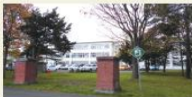
江別市立江別第三中 (徒歩5分/約350m)