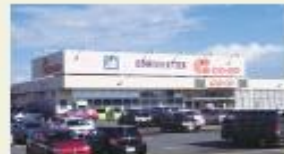
コープさっぽろ (徒歩4分/約300m)