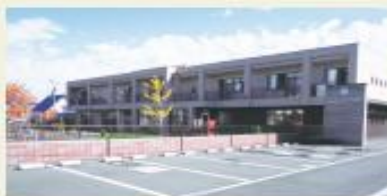
元江別わかば幼稚園 (徒歩14分/約1.1km)