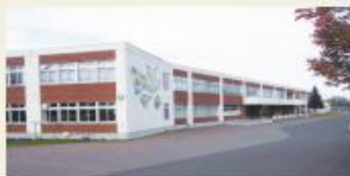
江別市立いずみ野小学校 (徒歩1分/約100m)