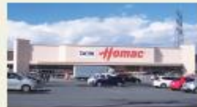
ホームック元江別店 (徒歩4分/約300m)