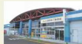
ホクレンショップ (徒歩8分/約650m)