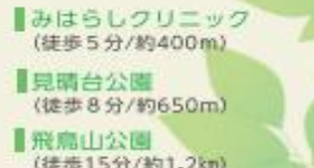
みはらしクリニック (徒歩5分/約400m)