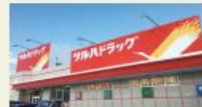
ツルハドラッグ (徒歩6分/約450m)