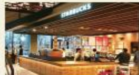
スターバックスコーヒー (徒歩10分/約850m)