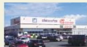
コープさっぽろ (徒歩4分/約300m)