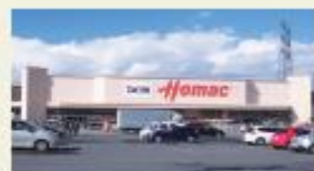
ホームック元江別店 (徒歩4分/約300m)