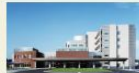
江別市立病院 (徒歩15分/約1.2km)