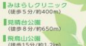
みはらしクリニック (徒歩5分/約400m)