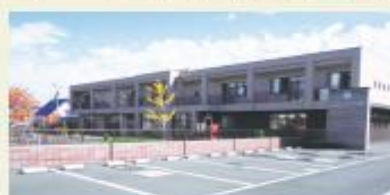
元江別わかば幼稚園 (徒歩14分/約1.1km)