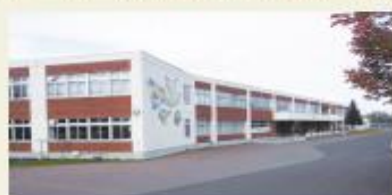
江別市立いずみ野小学校 (徒歩1分/約100m)