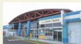
ホクレンショップ (徒歩8分/約650m)