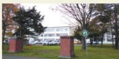
江別市立江別第三中 (徒歩5分/約350m)